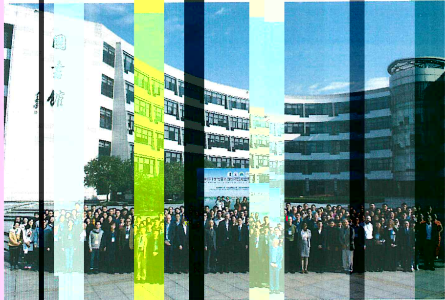
首届食品科学与营养国际研讨会 (2016年11月, 中国杭州)